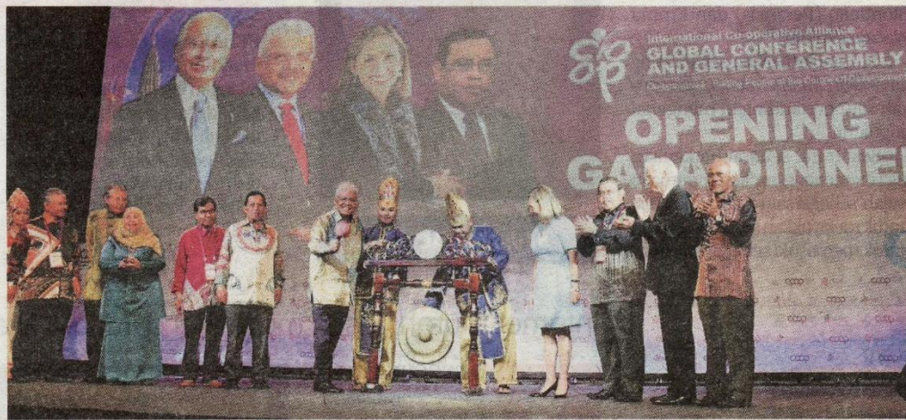
Menteri Perdagangan Dalam Negeri, Koperasi dan Kepenggunaan, Datuk Seri Hamzah Zainuddin mewakili negara merasmikan Persidangan Global dan Mesyuarat Agung Persekutuan Koperasi Antarabangsa 2017.

bagi tahun 2017 pula mampu mencapai sekitar RM45 billion.