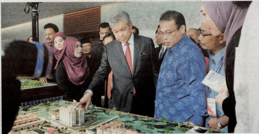
Timbalan Perdana Menteri, Datuk Seri Dr Ahmad Zahid Hamidi bersama Abdul Fattah melihat model bandar koperasi, Coop-City pertama di Malaysia dan Asia yang sedang dibina di Bandar Penawar, Johor.