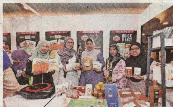
Pelbagai produk koperasi telah berjaya menembusi pasaran antarabangsa.