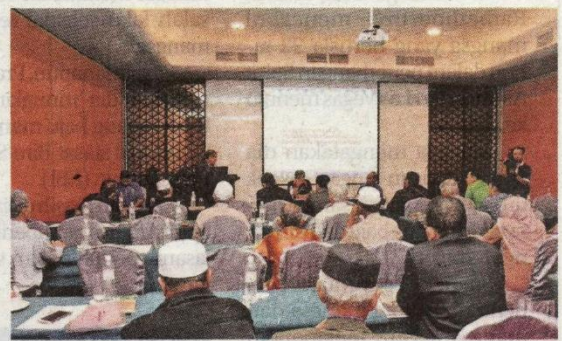
Untuk memperkasakan gerakan koperasi, Angkasa menganjurkan pelbagai program demi kebaikan mereka.