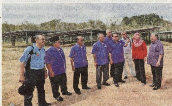
Angkasa melalui anak syarikatnya MyAngkasa turut melabur untuk projek ladang solarnya sendiri.

Justeru, usaha yang sedang dan akan dilakukan Angkasa, amat bertepatan untuk memastikan koperasi dapat memasarkan produk masing-masing serta meluaskan lagi pasaran ke seluruh dunia dan membantu kerajaan dengan menyumbang kepada perkembangan ekonomi negara.